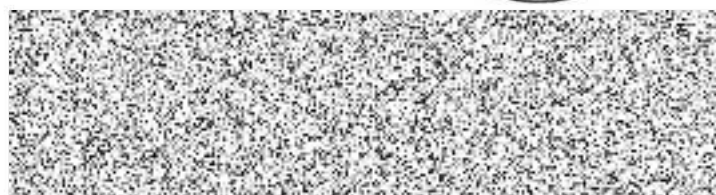
Jméno a příjmení funkce, název společnosti