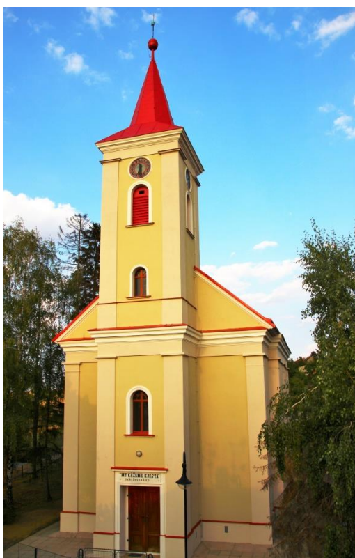
Kostel po omítce fasády roku 2018

Naše církev trvá ve svých sborech nepřetržitě od roku 1781. Tehdy, po vydání Tolerančního patentu, mohli potomci Jednoty Českých bratří a utrakvistů (husitů, podobojích) vyjít z ilegality a zakládat sbory, i když s velkými omezeními. Ačkoliv by se rádi, v návaznosti na českou reformaci, přihlásili k vyznání Českých bratří, museli zvolit jedno ze dvou povolených evangelických vyznání, buď helvetské (reformované) nebo augsburské (luterské).