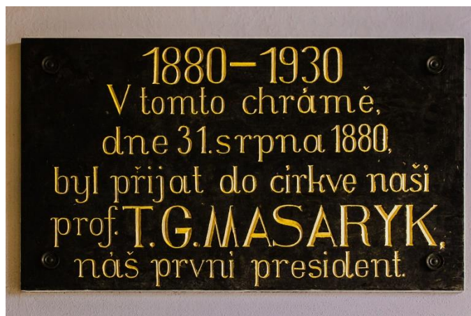
Pamětní deska ve vchodu do kostela

Kromě této desky najdete v interiéru heršpického Chrámu Páně kazatelnu, stůl Páně, varhany (prý jedny z nejlepších v naší církvi) vystavené podle vídeňského stylu a ve věži tři zvony a hodinový stroj.